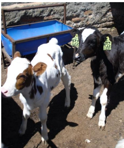
Menor a 61 días