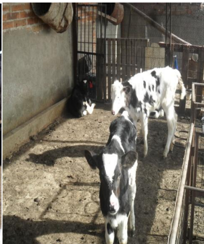
Entre 61 a 90 días