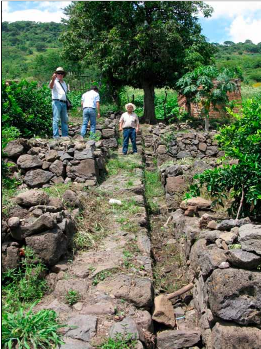
Galápagos con escalera y regadera en la parte central.