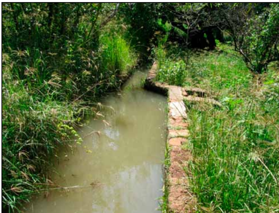
Terreros para capturar sedimentos y aprovecharlos en las huertas.

El otro tipo de terrero es una especie de estanque de medidas similares que se ubica en la trayectoria del canal o zanja. En realidad consiste en una ampliación de aquélla que sirve para atrapar los sólidos debido a que al ser más ancha la velocidad del agua disminuye permitiendo que tierra y demás materia que vaya por el cauce se asiente al llegar a la