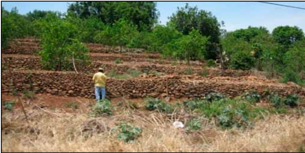
Reparación de galápagos. A la derecha del huertero se encuentran la pala y la barra.

temperatura que varían en lapsos de tiempo cortos aún en el día y a la sombra. Por ello el tipo de vegetación tiene su relativa importancia. Cada nivel tiene su biodiversidad vegetal propia. Hay zonas para cultivos como el maíz y el frijol, otras que son boscosas, una más para plantas y hierbas de montaña y una más de temporal. 15