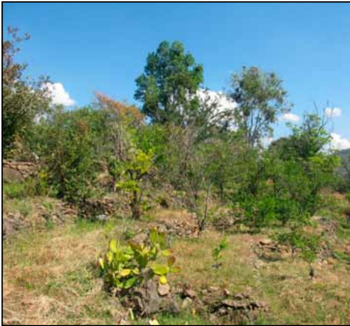
Perfil de una huerta en galápagos. Se evidencia la diversidad de árboles frutales y la diferente altura.

El principal objetivo de una terraza es generalmente reducir el escurrimiento y la pérdida de suelo, pero también contribuye a incrementar el contenido de humedad del suelo a través de mejorar la infiltración y reducir el pico de descarga a los ríos. Las terrazas también humedecen las rocas y gradualmente éstas se erosionan un poco, y eventualmente incrementa la riqueza mineral de los suelos.