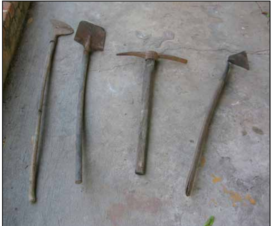
De izquierda a derecha: Coa, pala, alache y azadón.

En general las herramientas fueron fabricadas durante mucho tiempo en la localidad. Hoy sólo algunas son elaboradas por los maestros herreros que todavía se dedican a esas labores en Atotonilco. La mayoría de las herramientas son compradas en ferreterías. Por lo general los peones o jornaleros sólo cuentan con un par de herramientas: cazanga y tijeras de corte de fruta. El resto de herramientas son proporcionadas por los dueños de las huertas.