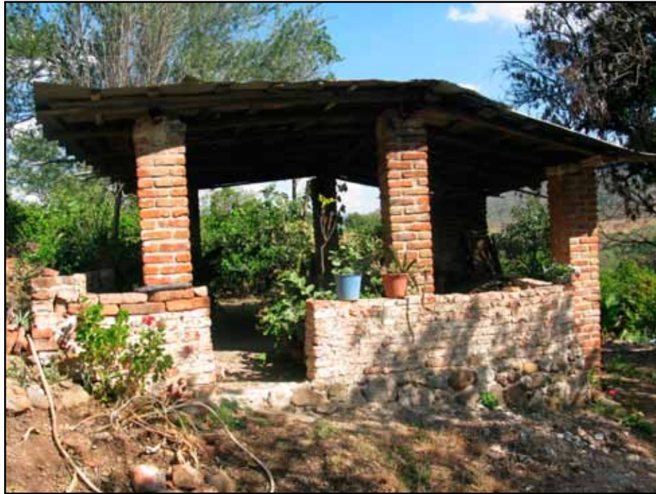
Tejabanes dentro de las huertas.

La comunicación del pueblo hacia las huertas, se hacía a través de angostas calles sin trazo llamadas callejones, mismos que los formaban para facilitar el tránsito diario de los trabajadores y arrieros, pero que además servían para delimitar los terrenos de los diferentes dueños. Estos callejones estaban cercados de alambre o piedra, y se les identificaba con algún nombre, que casi siempre, estaba relacionado con el del propietario de la huerta, alguna finca, o por algún otro lugar que quedara comprendido dentro del callejón (Orozco, 2007:20).