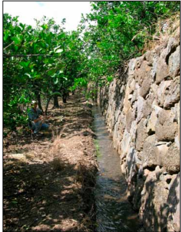
Regadera y galápago.

Son la vía fundamental de conducción del agua para el riego de huertas. Constituyen el complemento de las terrazas.