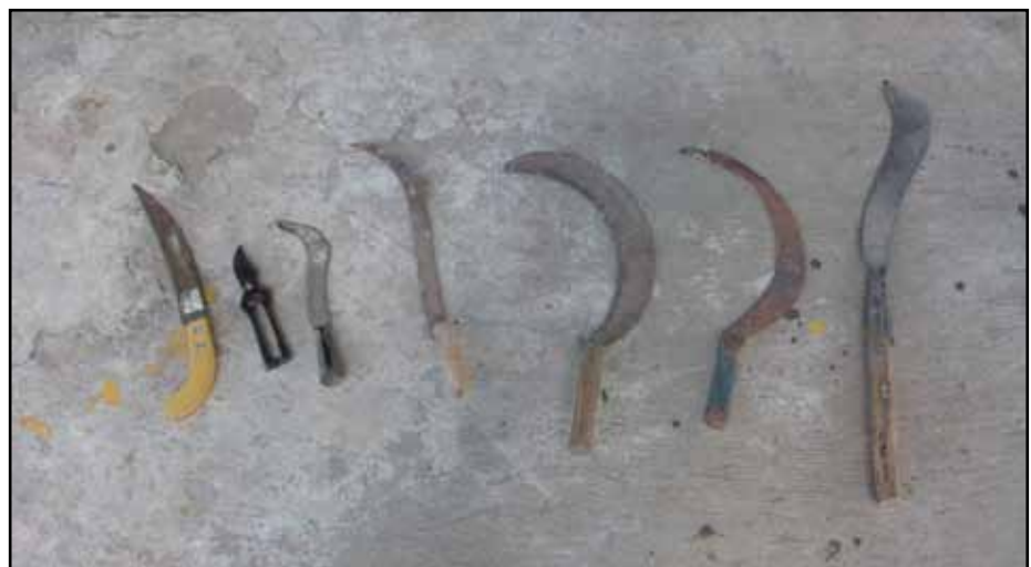
De izquierda a derecha: Serrote de mano o cuchillo sierra para poda, tijeras de corte de fruta, cazanga para corte de injertos, cazanga para poda y rozaderas o cazangas convencionales.