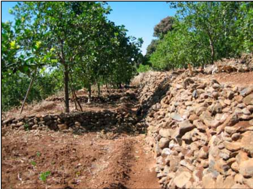
Cajete con retén de piedras (arriba) y sin retén de piedras (abajo).