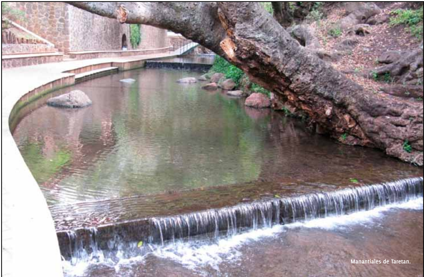
Manantiales de Taretan.

De esas acequias o zanjas que corrían aprovechando la pendiente del terreno de norte a sur, se desprendían otras