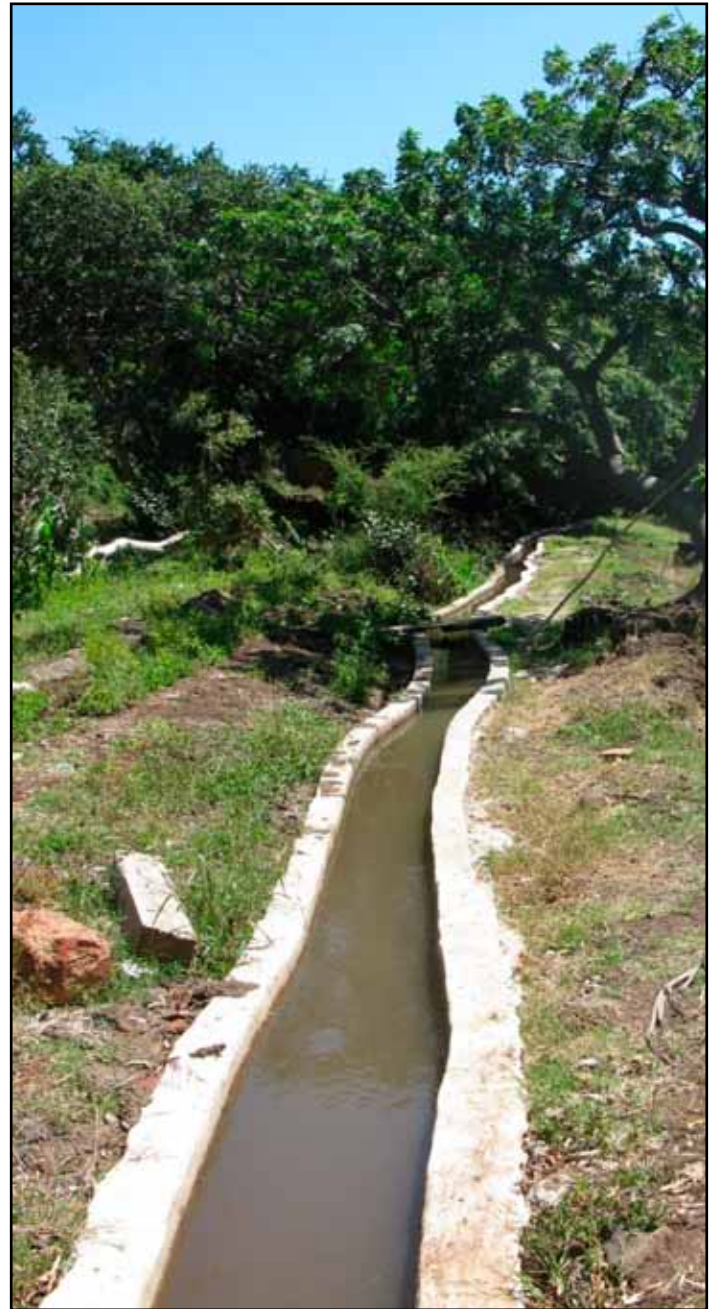
Canal principal atravesando una huerta.