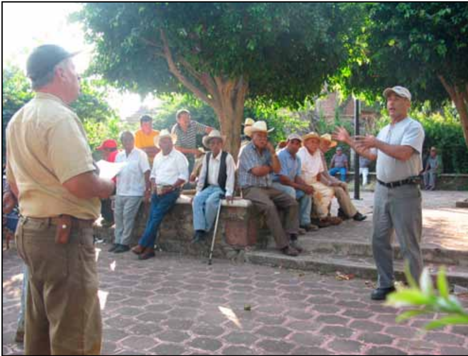
Reunión de huerteros.

las regaderas de cada una de las huertas. A él compete el mantenimiento general de las obras hidráulicas y muchos de los problemas son encarados por él, antes que sean expuestos a quienes presiden formalmente la asociación.