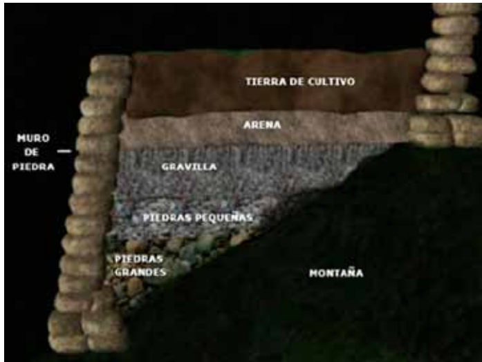
Estructura de un andén o terraza.

lo necesario para vivir. Y en efecto, bastaría lo cultivado y criado (en pequeñas granjas) en las huertas para resolver la reproducción de un grupo familiar.