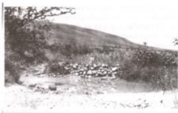
"Canal que conduce el agua del arroyo Los Sabinos a la laguna de Cajititlan", 1926, Cajititlan, Tlajomulco, Jalisco, AHA, Aprovechamientos Superficiales, c. 259, exp. 6235.

tros cuadrados y ocupa solamente 12.78% del territorio estatal. Esta región está conformada por 10 municipios: Mezquitic, Huejuquilla el Alto, Huejúcar, Colotlán, Villa Guerrero, Santa María de los Ángeles, Bolaños, Totatiche, San Martín de Bolaños y Chimaltitán (véase el anexo 2). Los municipios de Mezquitic, Bolaños, Huejuquilla el Alto, Chimaltitán y San Martín de Bolaños poseen escasa superficie de riego e infraestructura, lo que limita las posibilidades de desarrollar una agricultura intensiva. A esta situación se suman fuertes problemas en la tenencia de la tierra, además de que es la zona menos comunicada de la región. En cambio, los municipios de Colotlán, Totatiche, Villa Guerrero, Huejúcar y Santa María de los Ángeles poseen mejores condiciones para el desarrollo de la agricultura y la ganadería. Estos municipios cuentan con infraestructura para el establecimiento de algunos sistemas de riego y en ellos los conflictos por la posesión de la tierra son escasos y existen mejores vías de comunicación. Los municipios de Colotlán y Santa María de los Ángeles forman una microrregión con características muy particulares que han favorecido su desarrollo socioeconómico. El clima, la topografía y la precipitación son suficientes para las actividades agrícolas, así como para la producción de pastos y forrajes para la ganadería con riego y temporal.