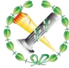
Facultad de Geografía e Historia