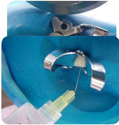
Irrigación con hipoclorito de sodio