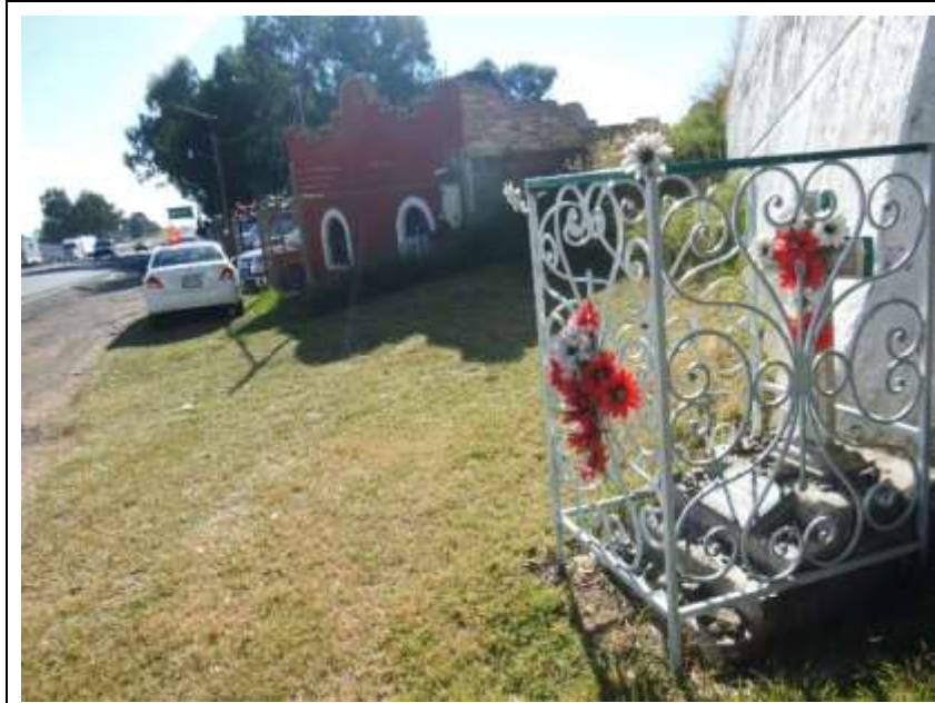
Algunos cenotafios con estatuas y cruces, colocadas sobre los montículos que fueron contruidos a los lados de la carretera, están 'protegidos' con rejas metálicas.